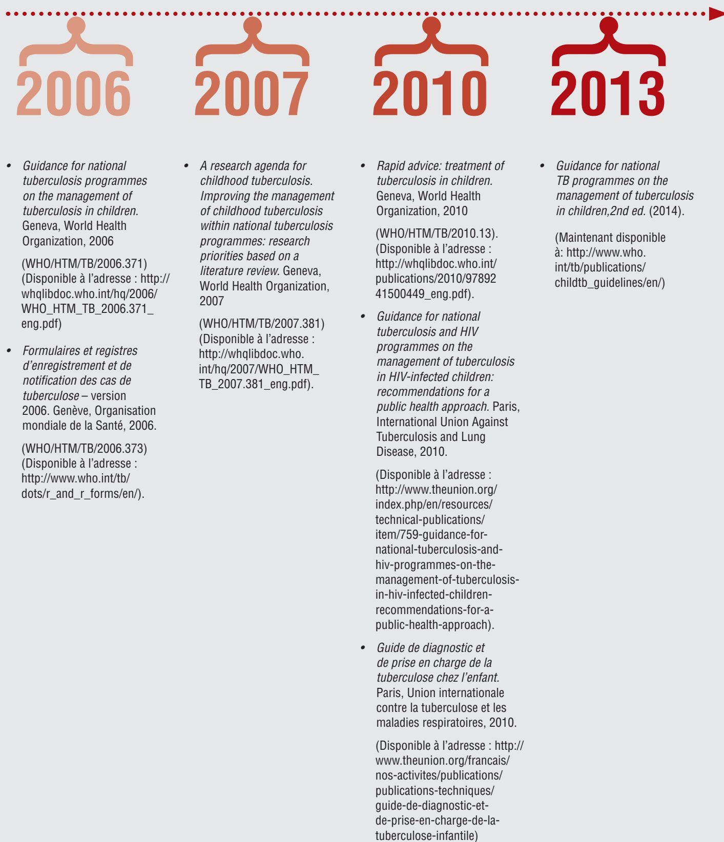
Figure 1. Orientations et directives publiées avec la participation du sous-groupe Tuberculose de l'enfant du groupe de travail sur l'extension de la stratégie DOTS du Partenariat Halte à la tuberculose